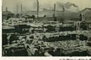
美濃路と起町の街