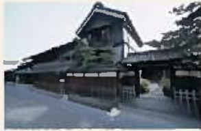
万国商船汽船(伊勢屋)倉庫(有松町)